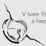
V tvare 1/2 bubliny a hviezdčky