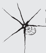
V tvare hviezdčky